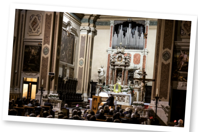
Il primo dei concerti celebrativi del restauro dell'Organo Zanin del duomo di San Vito al Tagliamento