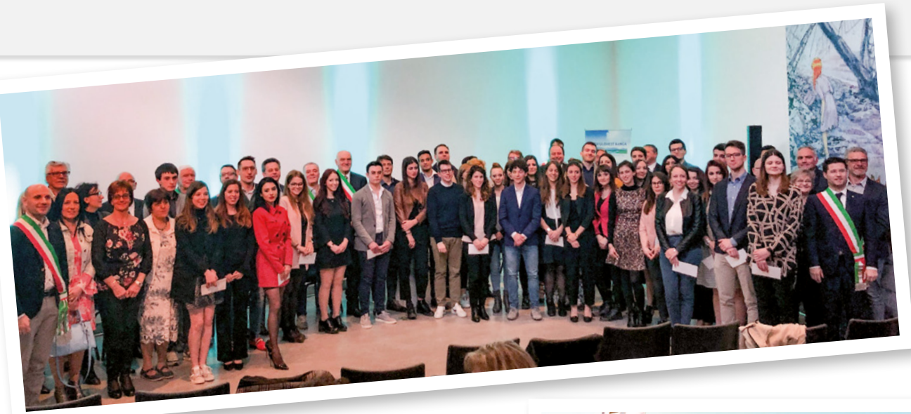
Cerimonia di consegna delle borse di studio a 52 Soci o figli di Soci di Friulovest Banca