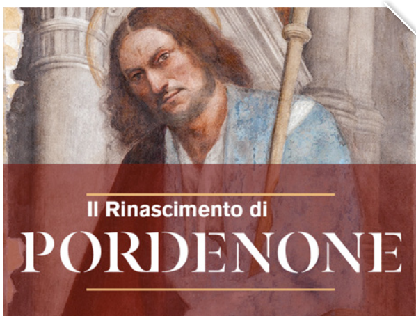
L'immagine simbolo della mostra

FINO AL 2 FEBBRAIO LA GALLERIA D'ARTE MODERNA OSPITA LA GRANDE MOSTRA SUL DE' SACCHIS E IL SUO TEMPO