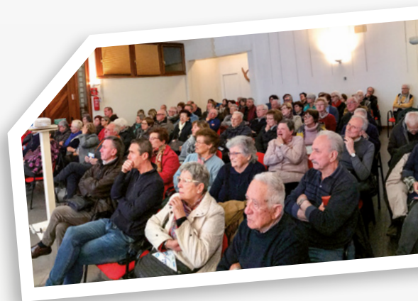
Incontro Invecchiare con destrezza, Montereale Valcellina

Ciascuno è protagonista del futuro del nostro Paese e la salute è un affare di tutti. Crediamoci!