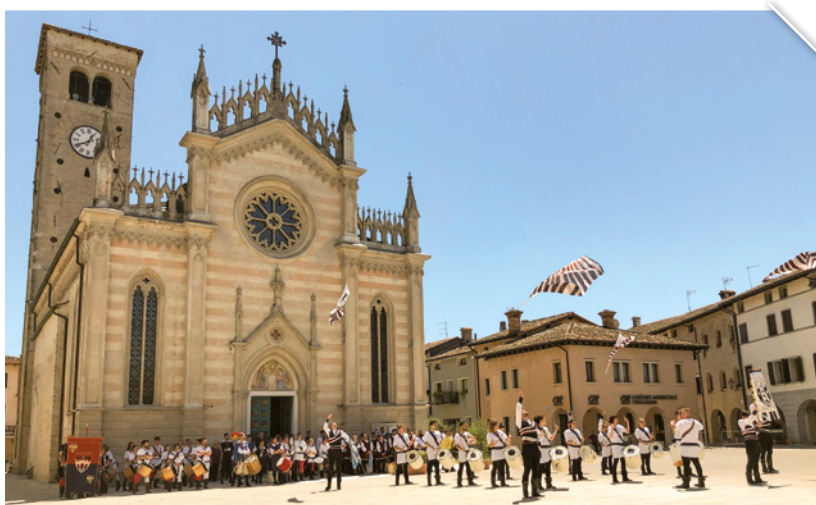
Il Duomo di Valvasone

IL PIÙ GIOVANE COMUNE DEL FRIULI OCCIDENTALE, SORTO NEL 2015, HA ANTICHE RADICI, NON SOLO RISALENTI AL PERIODO MEDIEVALE