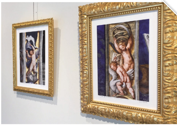
I Putti del Pordenone fotografati dal maestro Elio Ciol

I PUTTI DELL'ARTISTA NELLE FOTO DI ELIO CIOL: IL MAESTRO DI CASARSA RACCONTA LA FORZA DEL CONTERRANEO