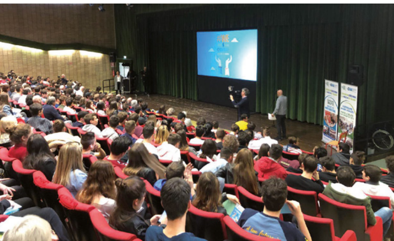
#We4others 2019: il pubblico di Udine