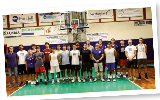
La prima squadra della VIS Spilimbergo alla prima seduta di allenamento per la stagione 2019/2020