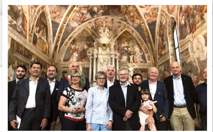
Il 16 luglio 2019 sono stati restituiti alla comunità di Lestans i preziosi affreschi di Pomponio Amalteo che decorano la volta e le pareti del presbitero della chiesa di Santa Maria Assunta