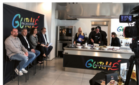
Al fianco di Palagurmè anche nella terza edizione di "The Best Sandwich"