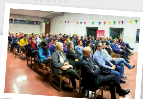
Alimenti e sport, Campagna di Maniago