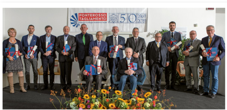
Il Consorzio di Sviluppo Economico Locale del Ponte Rosso - Tagliamento ha celebrato i 50 anni di fondazione