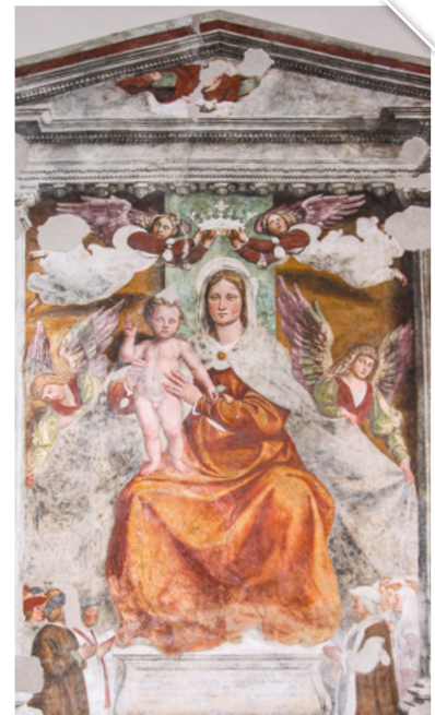
Il Pordenone, Madonna con il Bambino , 1525, Pinzano al Tagliamento, Chiesa di S. Martino

Non solo affreschi, il Pordenone è l'autore di pitture a decorazione di due importanti organi: quello rinascimentale del Duomo di Santa Maria Maggiore a Spilimbergo dove nel 1524 realizzò i riquadri della cantoria, i fianchi della cassa con motivi a grottesca e le figure dei profeti David e Daniele, e le grandi scene delle portelle. E oltre, a Valvasone nel cui Duomo del Santissimo Corpo di Cristo si trova l'unico organo cinquecentesco originale della scuola