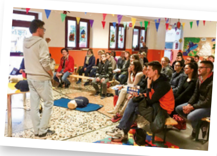
Corso sul primo soccorso pediatrico a Bagnarola