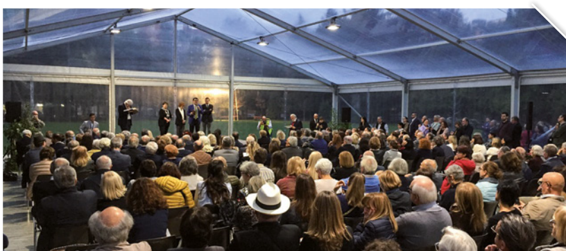
Inaugurazione della mostra

IN CENTINAIA ALL'INAUGURAZIONE NEI DUE APPUNTAMENTI IN GALLERIA D'ARTE E AL TEATRO VERDI