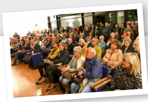
Alimenti e salute, Casarsa della Delizia