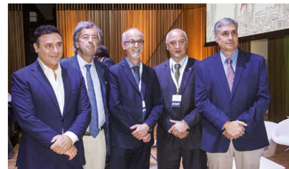
I promotori del Patto trasversale per la Scienza