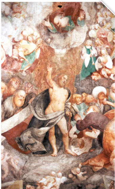
Giovanni Antonio de' Sacchis detto il Pordenone Cristo trionfante , Chiesa di S. Pietro, Travesio

DALLA PRIMA OPERA DATATA E FIRMATA A VALERIANO, ALLA "CAPPELLA SISTINA" DI TRAVESIO: VIAGGIO NEI LUOGHI DEL PORDENONE