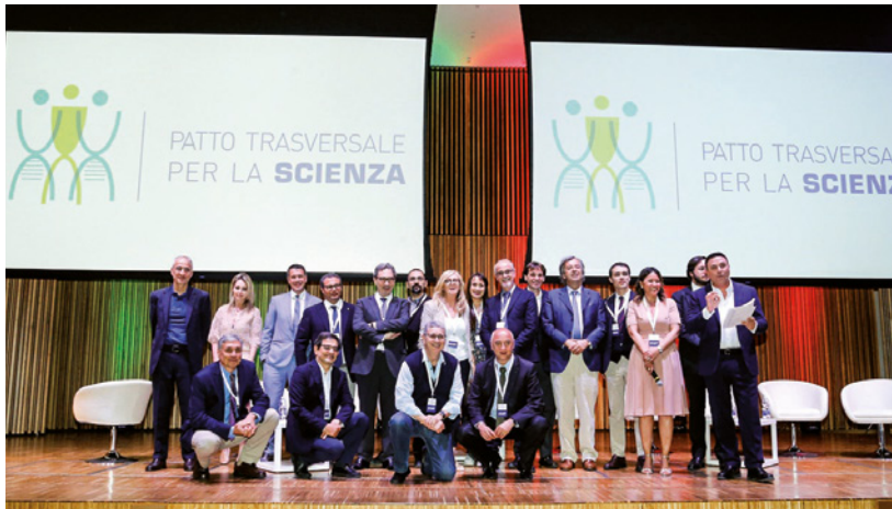
Gli scienziati che hanno sottoscritto il documento