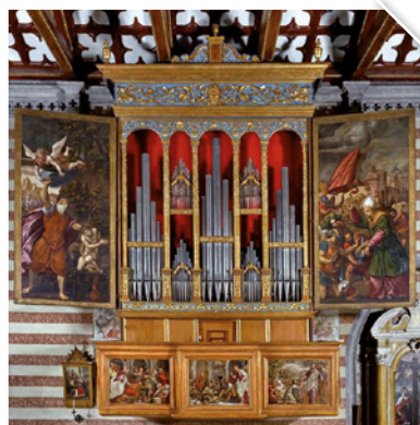
L'organo del duomo di Valvasone

Vaste aree dedicate all'agricoltura, a partire dalla filiera vitivinicola nonché due zone artigianali ad Arzene, nell'ex caserma Tagliamento e a Valvasone in località Tabina, rappresentano il cuore dell'economia comunale, alla quale si aggiungono, soprattutto nel centro storico valvasonese, il commercio e il turismo. Qui i visitatori si recano lungo tutto il corso dell'anno, con il culmine delle presenze nel secondo weekend di settembre quando si svolge la grande rievocazione medievale. Friulovest Banca ha una filiale attiva ad Arzene e un bancomat a Valvasone, al servizio della comunità.