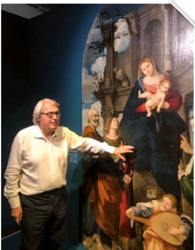
Vittorio Sgarbi, curatore della mostra Il Rinascimento di Pordenone

IL CRITICO D'ARTE VITTORIO SGARBI HA CURATO L'EVENTO SUL PICTOR MODERNUS, "NARRATORE" POTENTE E PREPOTENTE