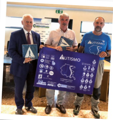
Conferenza stampa di presentazione de "Il cammino celeste - Autismo percorso di vita"