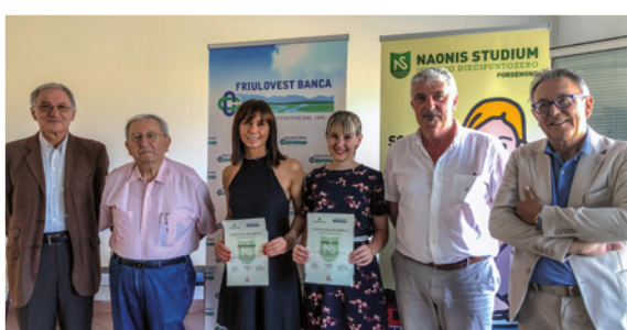
Friulovest Banca ha riconosciuto due borse di studio a studenti meritevoli della Naonis Studium