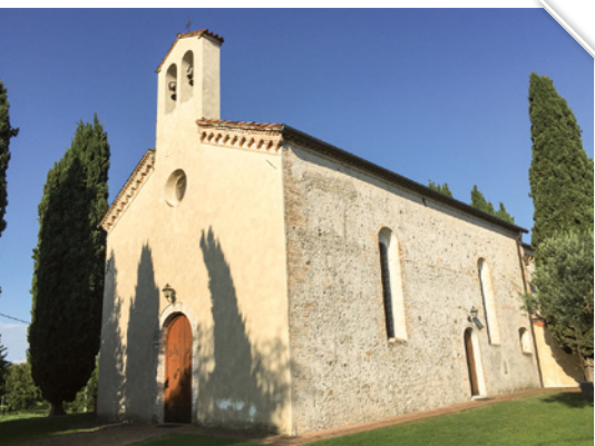
La chiesa di Santa Margherita ad Arzene

custodita a Valvasone) e ospita ancora oggi il più antico esempio di organo monumentale cinquecentesco di scuola veneziana, le cui portelle, anteriori, sono state dipinte da Il Pordenone, uno dei maestri del Rinascimento italiano.