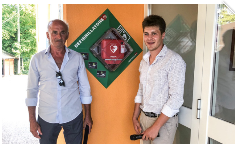
Inaugurazione della nuova casa del Circolo culturale ricreativo di Aurava

NELLA EX SCUOLA UN CENTRO AL SERVIZIO DELLA COMUNITÀ