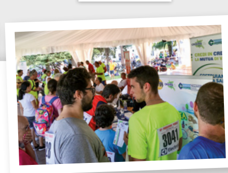
Cittadella della Salute durante Pordenone Pedala 2019