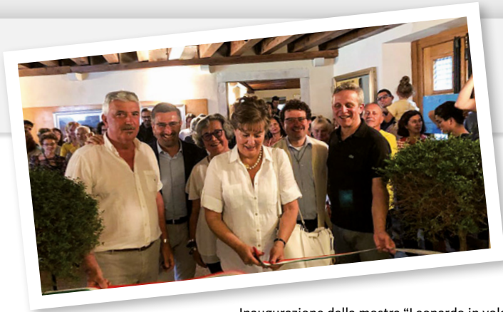
Inaugurazione della mostra "Leonardo in volo. 500 anni di macchine volanti" a Meduno