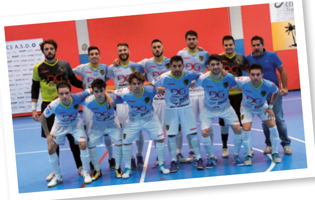
I ragazzi del Maccan Prata calcio a 5