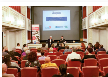
Il soccorso in caso di arresto cardiaco, San Vito al Tagliamento