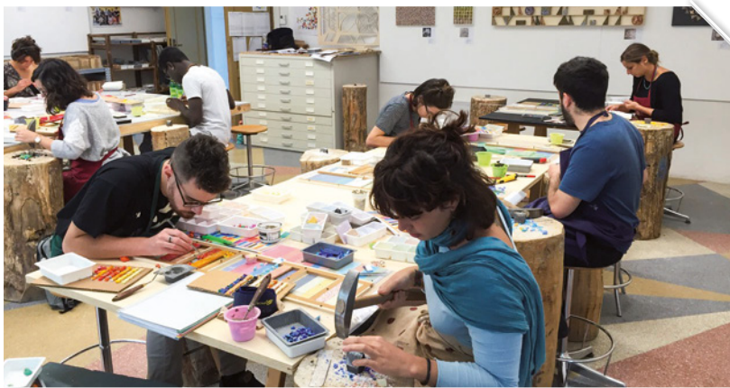
Gli allievi in uno dei laboratori

L'ISTITUTO DI SPILIMBERGO PROPONE UN CORSO PER PROFESSIONISTI AD ALTO GRADO DI FORMAZIONE