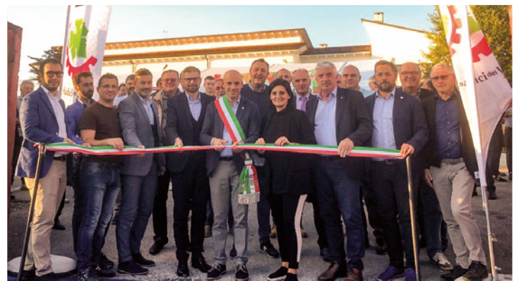
Taglio del nastro della sesta edizione della Fiera agricola "Viticoltura d'eccellenza"