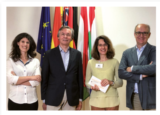
Friulovest Banca ha sostenuto il Liceo Le Filandiere di San Vito al Tagliamento per l'acquisto di nuovi pc dopo il furto subito