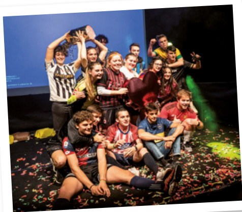
Gli studenti del liceo sportivo di Maniago, vincitori dell'edizione 2018-2019 di Keep the Beat