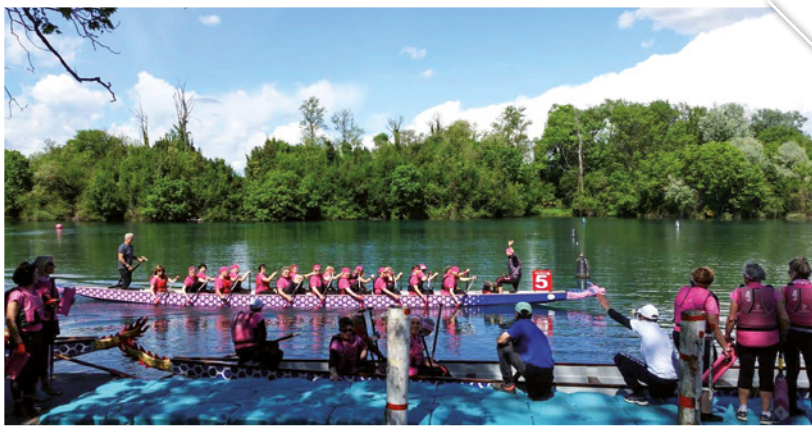
Le donne del Drago Rosa Burida e il sogno della casa al lago

AD APRILE LA SECONDA EDIZIONE DEL FESTIVAL DI DRAGONBOAT, CON EQUIPAGGI DI TUTTA ITALIA