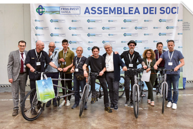
La consegna dei tandem in assemblea

UN IMPEGNO COSTANTE PER IL SUPPORTO DELL'INTERO TERRITORIO