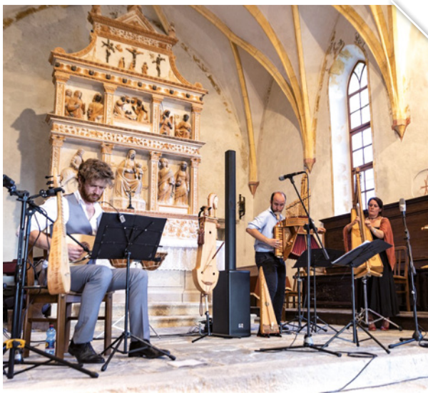
Concerto con gli strumenti ispirati a Leonardo nell'antica Pieve d'Asio

L'ASSOCIAZIONE NATA NEL 2018 DA UN GRUPPO DI VOLONTARI ORGANIZZA VARI EVENTI CULTURALI