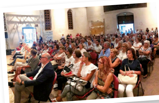
Costruiamo insieme la salute, Pordenone